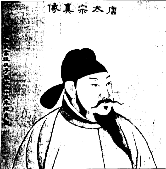
จักรพรรดิถังไท่จงฮ่องเต้ (ปฐมเหตุแห่งการเดินทางของพระถังซัมจั๋ง)